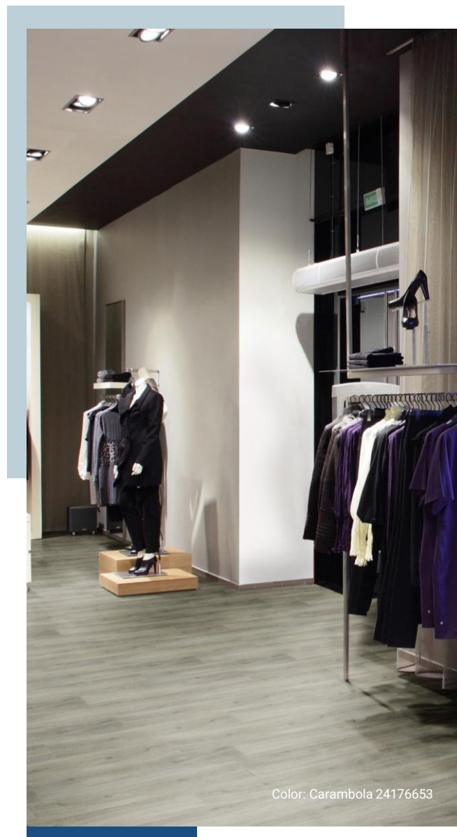
Color: Carambola 24176653