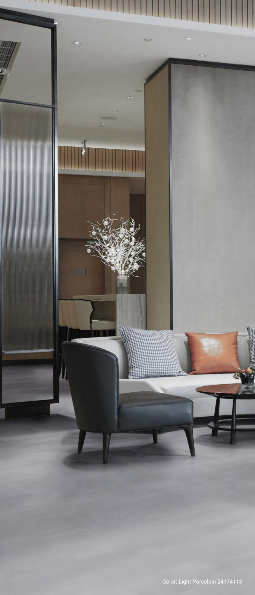
Color: Light Porcelain 24174113